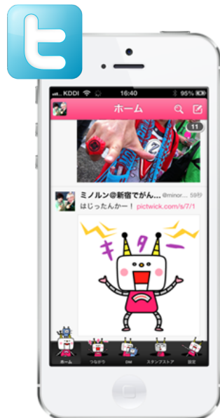
アプリ表示(タイムライン)