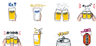
アサヒビール株式会社 カンパスタンプ