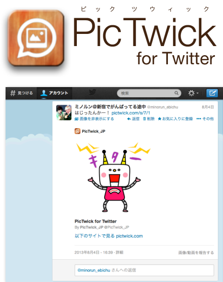
PC表示(タイムライン)