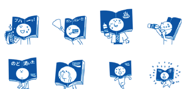
大塚製薬株式会社 ポリセット × カオポン