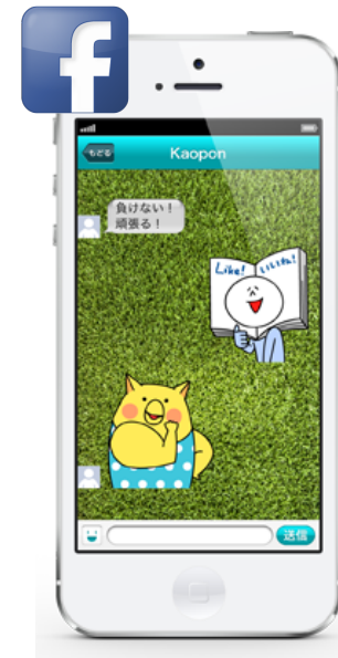
アプリ表示(メッセージ)