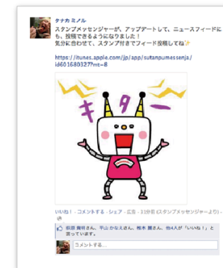
PC表示(ニュースフィード)