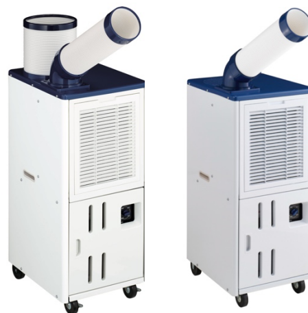
床置型スポットエアコン（JA-SPH26A/JA-SP26A）