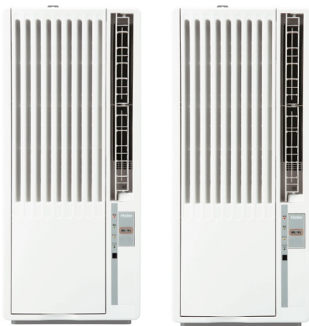
窓用ルームエアコン（JA-18Z/JA-16Z）

ハイアールジャパンセールス株式会社（本社：大阪市、代表取締役社長：杜 鏡国）は、室外機・工事不要で設置が簡単な「窓用ルームエアコン（JA-18Z/16Z）」と、スリムボディで使用場所を選ばない「床置型スポットエアコン（JA-SPH26A/SP26A）」の4機種を、全国の家電量販店、ホームセンター、GMS、WEB通販などで2024年4月1日より順次発売いたします。