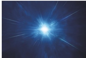
紫外線の影響によって発生する活性酸素