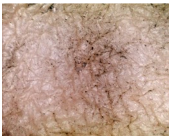
フィットディフェンス ミストを塗布していない場合