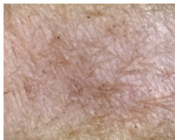
フィットディフェンス ミストを塗布した場合