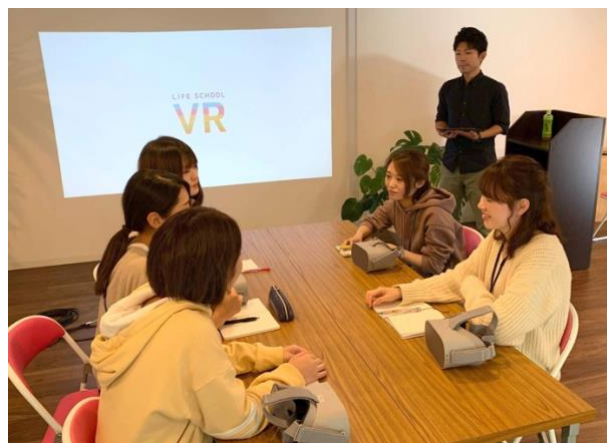
▲VRで集合研修を行い、その後はそれぞれの経験談などを踏まえた盛んな意見交換が行われました。

体験者コメント：保育をする時に、よく言われるのが「子どもの目線に立って」や「子どもと目線を合わせて」ということなんですが、本当に子どもの目線で体験することができるので、本当に良いと思いました。