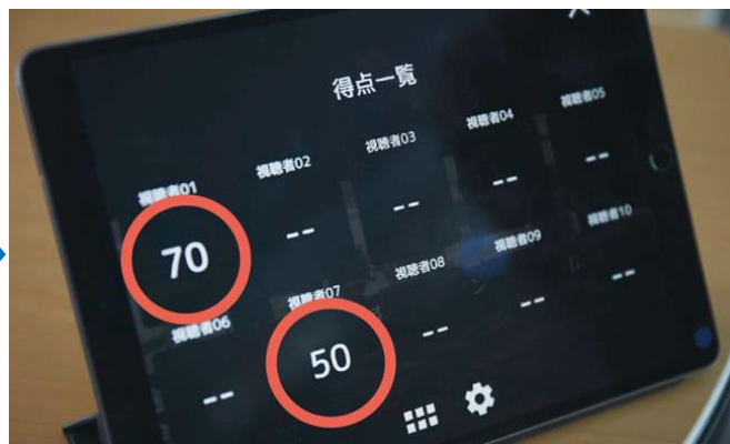
▲集合研修での受講者のVR視点をスコア化し、一覧で結果表示