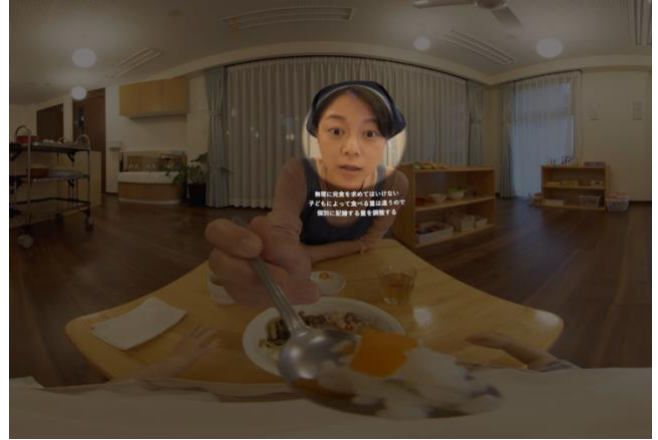
▲解説編で悪いポイントの回答を学習