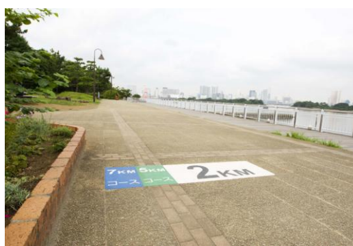
ランニングコース