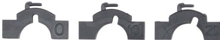
アームホルダー0°、10°、20° パーツが付属