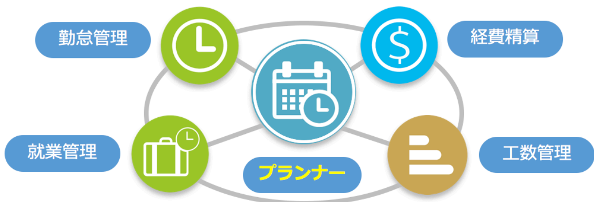
《図》プランナーを中心としたオフィスワーク・オートメーション

今回、その実績を活かして新たに提供する TeamSpirit WSP は、「プランナー」というカレンダー形式のビューを中心にして、経費精算／勤怠管理／工数管理などを連携させることで、事務作業の負荷を最小限に軽減し、知的生産のための時間を創出することに成功しました。