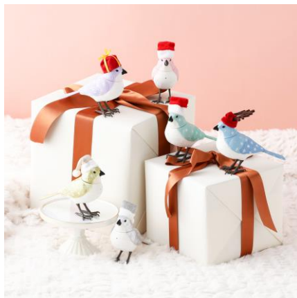
クリスマス限定 ミュージックバード ¥1,200

カラフルなお花入りのネイルオイルとハンドクリームの手ケアセットです。ほんのり香る香りが休憩などのリラックスタイムや、工作中、勉強中のリフレッシュにもぴったりです。ご友人や同僚への気取らないプチギフトにおすすめです。