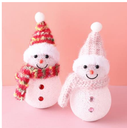
ライティングオブジェ スノーマン M

クリスマスらしいサンタクロースやスノーマン、クリスマスツリーのオブジェが入ったミニサイズのスノードームです。いくつかが並べて飾ってもかわいいアイテムです。ちょっとしたクリスマスプレゼントにもぴったりです。