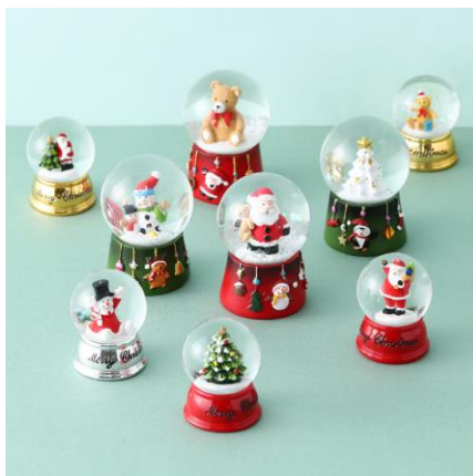
スノードーム各種

抗菌防臭機能を追加してリニューアルした人気のハンカチタオルシリーズです。毎日使うハンカチタオルは何枚あっても喜ばれること間違いなし。いつも持ち歩くアイテムだからこそ使うたびに嬉しくなるかわいいデザインはギフトにぴったりです。