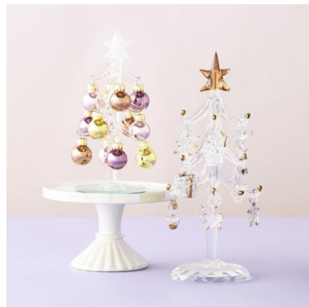
ガラスツリー各種 S : ¥1,200~/M : ¥1,800~ L : ¥3,000~

人の気配に反応して首を振りながら全 6 曲のクリスマスソングを歌うミュージックバードです。歌うときの絶妙な表情がかわいらしくクセになる、クスッと笑えるクリスマス限定のトイです。パーティーでも盛り上がるアイテムです。