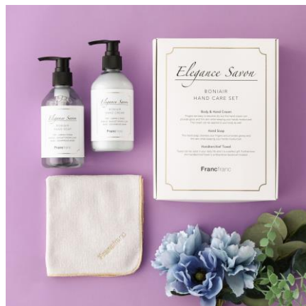
【新作】ボニエールハンドケアギフトセット ホワイト ¥2,500