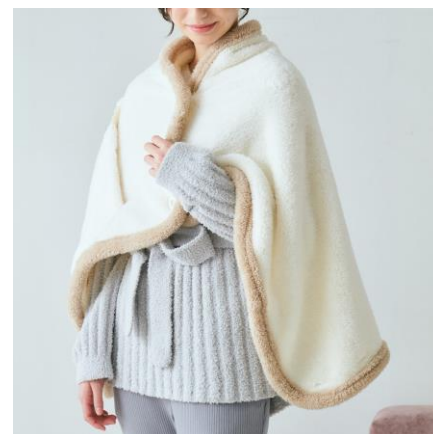
ウォームフリース 4WAY ポンチョ ¥2,900

コスメのようなカラーバリエーションが今年っぽいシンプルデザインのステンレスボトルです。マットな質感が魅力的な 4 色をご用意しました。保温保冷性に優れた真空二重構造。オフィスでさりげなく自慢したくなる大人かわいいギフトにぴったりのアイテムです。