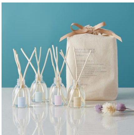
ソフィスティンス ルームフレグランスセット ¥3,900

クリスマス限定デザインのツリーをイメージしたハーバリウムです。置く場所を選ばず、気軽に美しい植物をお楽しみいただけます。大人っぽくお洒落なクリスマスギフトにぴったりです。