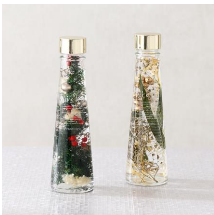
クリスマス限定 ハーバリウム ¥3,000

クリスマス限定デザインのツリーをイメージしたハーバリウムです。置く場所を選ばず、気軽に美しい植物をお楽しみいただけます。大人っぽくお洒落なクリスマスギフトにぴったりです。