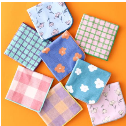
パロット 抗菌防臭ハンカチ各種