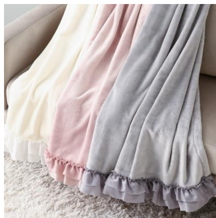
サテン フリル スロー S 80×150cm : ¥3,400 M 130×170cm : ¥4,400

洗練された香りが人気のソフィスティンス ルームフレグランスをプチサイズで 4 個セットにしました。お部屋によって香りを使い分けたり、色々な香り試すことができます。ゆったりと落ち着いた魅力的なフレグランスは大人ギフトにおすすめです。