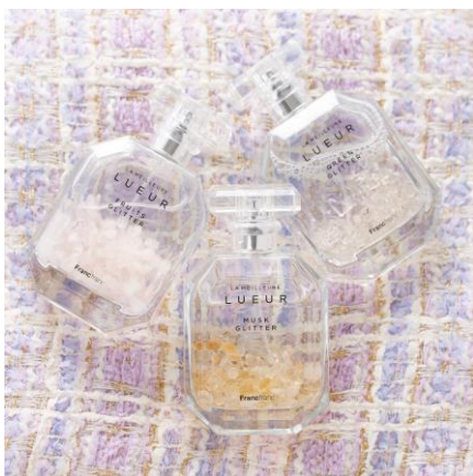
リュール ルームスプレー ¥2,400

香水瓶をイメージしたボトルと中のストーンが見映える、思わず飾りたくなるゴージャスでエレガントなルームスプレーです。好きなタイミングで香りを楽しみ、気分をリフレッシュすることができる、ギフトにも喜ばれるアイテムです。