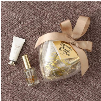
プチミニオン ネイルケアセット ¥1,000

カラフルなお花入りのネイルオイルとハンドクリームの手ケアセットです。ほんのり香る香りが休憩などのリラックスタイムや、工作中、勉強中のリフレッシュにもぴったりです。ご友人や同僚への気取らないプチギフトにおすすめです。