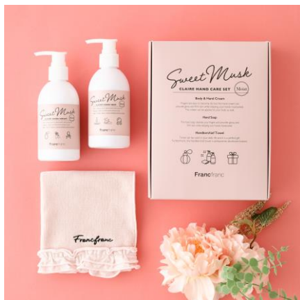
【新作】クレアハンドケアギフトセット ¥2,500

リラックスできる香りに包まれながら「手を洗う」「拭く」「保湿する」が叶うギフトセット