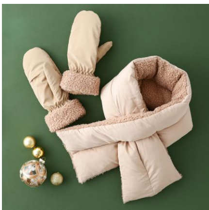
グローブ ポア : ¥3,200 ティベット ポア : ¥3,200

新作のフィンガーレスにもなるグローブとリバーシブルで使えるティベットです。使いやすいベージュとブラックの 2 色ご用意。ふかふかのポア素材とさらりとしたポリエステル素材の組み合わせがトレンド感あるシリーズです。特別感のあるギフトパッケージ入りなので、肌寒い季節の贈り物におすすめのアイテムです。