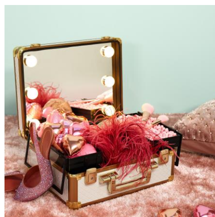
ヴァリーズ ハリウッドボックス S ¥29,000

お気に入りのアクセサリや大切なジュエリーをお洒落に収納できる 2022 年新作のジュエリーボックスです。旅行時など持ち運びにも便利なかawaiiサイズ感のトラベルジュエリーボックスとシンプルながらも使い勝手の良い S サイズをご用意。思い出と一緒に贈れるアイテムです。