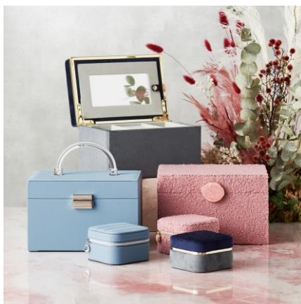
ジュエリーボックス各種 トラベルジュエリーボックス : ¥2,000 ジュエリーボックス S : ¥6,800

新作のフィンガーレスにもなるグローブとリバーシブルで使えるティベットです。使いやすいベージュとブラックの 2 色ご用意。ふかふかのポア素材とさらりとしたポリエステル素材の組み合わせがトレンド感あるシリーズです。特別感のあるギフトパッケージ入りなので、肌寒い季節の贈り物におすすめのアイテムです。