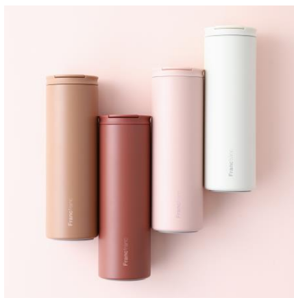
ワントーン ステンレスボトル 350ml : ¥2,200 500ml : ¥2,700

香水瓶をイメージしたボトルと中のストーンが見映える、思わず飾りたくなるゴージャスでエレガントなルームスプレーです。好きなタイミングで香りを楽しみ、気分をリフレッシュすることができる、ギフトにも喜ばれるアイテムです。