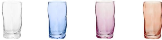
【商品名】スウェルトンブラー 【種類】クリア/ブルー/ピンク/オレンジ 【価格】各 ¥800

波のようなウェーブ形状が夏らしく涼し気なデザインが魅力のタンブラーです。ハンドペイントシリーズの食器とのコーディネートがおすすめです。