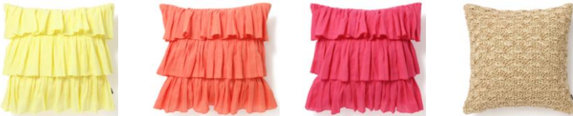
【商品名】リネンフリル クッションカバー 【種類】イエロー/オレンジ/ピンク 【価格】各 ¥4,500 【商品名】ペーパークロシェ クッションカバー ナチュラル 【価格】¥3,500

インドの伝統的な染色技法であるブロックプリントのクッションカバーです。機械には生み出せないハンドメイドならではの美しく特別な風合いが楽しめます。