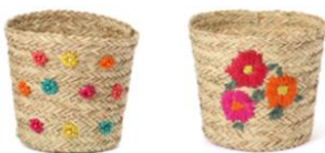
【商品名】シーグラス バスケット 【種類】マルチ/ピンク 【価格】各 ¥2,500

ざっくり編んだデザインが夏らしい印象のバスケットです。スローを入れたり、散らかりがちな小物類をまとめて見せる収納アイテムとしてもおすすめです。