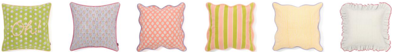
【商品名】ブロックプリント クッションカバー 【種類】グリーン/パープル/ピンク/ピンク×グリーン/イエロー/ライトブルー 【価格】各 ¥3,500

インドの伝統的な染色技法であるブロックプリントのクッションカバーです。機械には生み出せないハンドメイドならではの美しく特別な風合いが楽しめます。