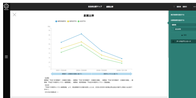
【福岡市の創業比率の推移(2001年～2012年)】 起業・創業の活発度合いを示す「創業比率」の推移を、全国平均や他の自治体と比較

例えば、起業・創業の活発度合いを示す「創業比率」の推移を、全国平均や他の自治体と比較することができます。さらに自らの自治体の創業比率は全国第何位なのかも把握できます。また、ランキング上位の自治体がどこかも把握できるので、それらの自治体がどのような創業施策を講じているかを調べて参考にすることができます。