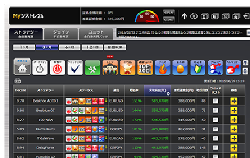
「My シストレ 24」