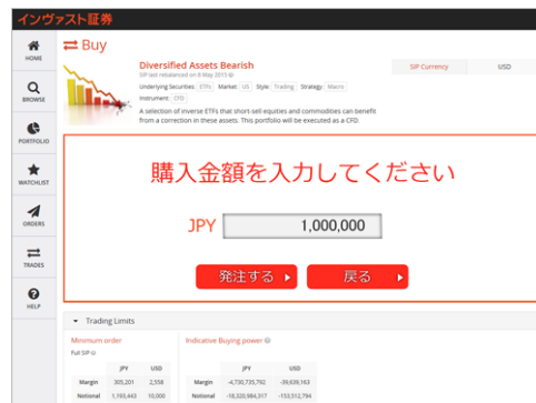
※画面は開発中の画面イメージです。実際の内容とは異なります。

サービスリリース時期が確定しましたら別途詳細をご報告します。 ※リリースは2016年春を予定しております。