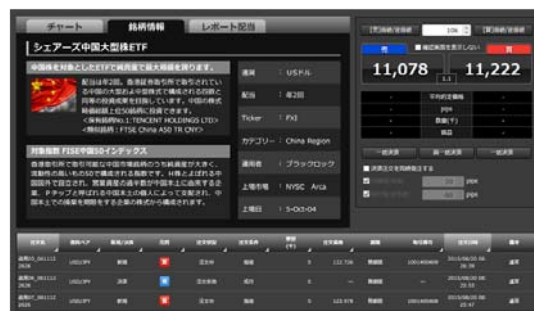
※画面は開発中の画面イメージです。実際の内容とは異なります。

サービスリリース時期が確定しましたら別途詳細をご報告します。 ※リリースは2016年度中を予定しております。