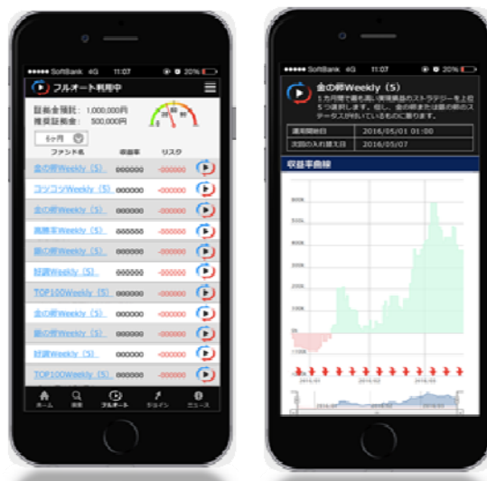
スマホ版開発画面イメージ

スマホ版は、スマートフォンにて「My ページ」にログイン後、「My シストレ 24 ログイン」ボタンをクリックしてご覧いただけます。アプリをダウンロードする必要はありません。