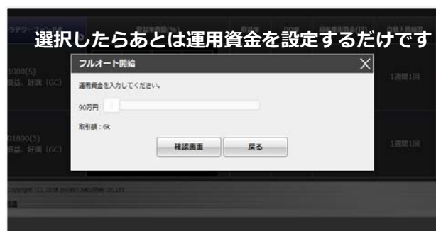
開発画面イメージ

フルオートファンドの設定を「オン」にすると選択したファンドの運用が開始されます。入れ替え時点では、稼働しているストラテジーを全て稼働停止にし、設定条件に従って新たなストラテジーが自動的に選択されます。フルオートファンドの稼働を止めたいときは設定を「オフ」に変更するだけです。