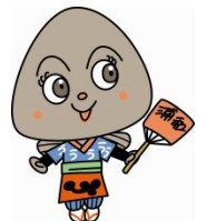
浦和うなこちゃん