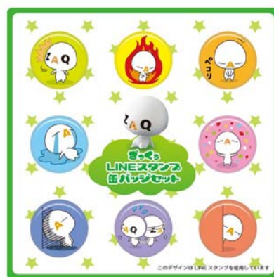
＜ざっくう LINE スタンプ特製オリジナルバッチセット＞

株式会社ジュピターテレコム(J:COM、本社：東京都千代田区、代表取締役社長：森 修一)のグループ会社である株式会社テクノロジーネットワークス(本社：東京都千代田区、代表取締役社長：西尾 武)は、2013 年 4 月 2 日から 29 日まで、無料通話・無料メールアプリ「LINE(ライン)」で配信していたケーブルインターネット ZAQ のキャラクター「ざっくう」のオリジナルスタンプの利用回数が、2 億回を突破したことを記念して、6 月 12 日より「ざっくう！LINE スタンプ ご利用 2 億回ありがとうキャンペーン」を実施いたします。