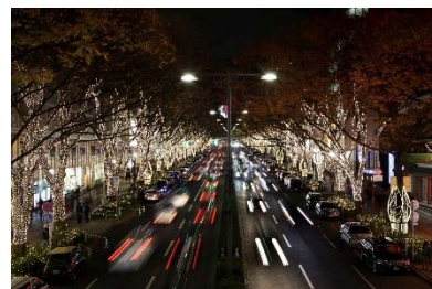
表参道 H. I. S. イルミネーション ベルシンフォニー (2009年)

桑沢デザイン研究所卒業。2004年ベルベッタ・デザイン設立。 【空気をデザインする】をテーマに、空間に関わる様々なクリエイションを手掛ける。近年の代表作として表参道イルミネーション、銀座イルミネーション『希望の翼』等、大型商業施設のクリスマスデザインを演出。スプツニ子!『Tranceflora - エイミの光るシルク』展、日本橋桜フェスティバル、『日本桜風街道』等のエキシビション・イベントにおける空間も演出。日産デザインセンター等の企業コミュニケーションスペース、商業店舗の内装からCIデザイン、プロダクトデザイン、グラフィックデザイン等、その活躍の場は多岐に渡る。2013年東京デザイナーズウィークでは、28年の歴史で初の女性クリエイターとして会場デザインを手掛ける。以来、ミラノ会場においても会場デザインに携わる。フランス国民美術協会(S.N.B.A.)主催サロン展 2014年金賞／審査員賞金賞、DSA優秀賞ほか多数受賞。DESIGN ASSOCIATION NPO 理事。