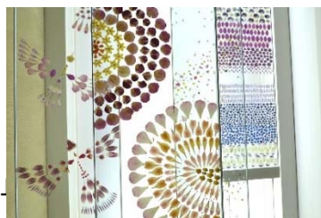
ミラノ国際博覧会日本館装花ディクション(花鳥風月、四季、地水火風)(2013年)

クリエイティブディレクター / 華道家 / フラワーアーティスト 青山学院大学経営学部卒業、慶應義塾大学大学院メディアデザイン研究科修了。 約600年続く華道の伝統や美学を意識しつつ、次世代の新たな表現方法を追求し、表現の場をストリートに求めたり、花に関係するファッションやプロダクト「IKEBANA KIT」から花贈りのウェブサービス「bouquet」を企画・制作するなど、生け花の枠に捕われない自由な活動を行っている。2007年、多様な手法を用いて花の魅力を発信するクリエイティブスタジオ「plantica」を結成。大型商業施設やリゾート施設の空間演出、NIKE、STARBUCKS、TOYOTA、SHISEIDOなどのイベント装花、CMや広告など多方面で装花ディクションを行なっている。2015年、ミラノ国際博覧会(万博)日本館にて装花ディクション(花鳥風月、四季、地水火風)を担当する。次世代を担う文化人としてUNIQLOのTVCM/広告にフリース・アンバサダーとして出演(2009, 2014年)、またフランス放送局「Canal Plus」や海外放送「NHK World」「Design Talks」のドキュメンタリー番組に取材されるなど、国内外のメディアからも活動が目まぐるしく注目されている。