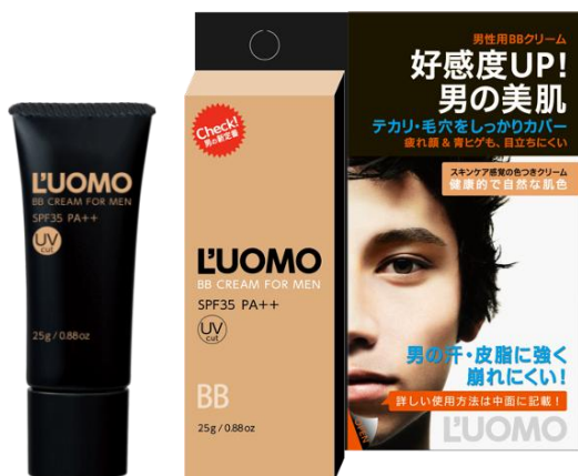
ルオモ マットキープBBクリーム

※1 出荷数(伊勢半調べ)2013年2月28日～2013年4月24日 ※2 小売店POSデータ 2013年3月7日～2013年3月13日