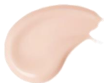
01 ローズ ピンクよりで 明るいオークル