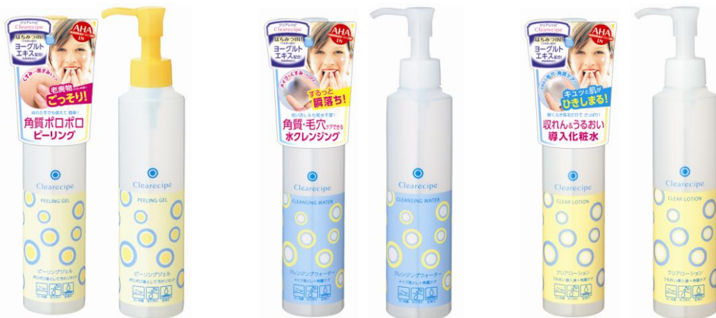
クリアレシピ 角質ピーリングジェル

肌磨きをコンセプトに開発されたクリアレシピシリーズは 明るく透明感のある、おいしい肌キーワード。 今、話題のヨーグルトエキス※A、はちみつ※B、AHA(リンゴ酸)※Cを配合。 ラインナップは、老廃物※Cごっそり除去の角質ピーリングジェル、 メイク落としから化粧水まで1本でできるクレンジングウォーター、 コットンでふき取るだけで角質オフと毛穴の引き締めができるクリアローション。 真冬の乾燥、血行不良でくすみ、ゴワつきが気になる肌には、角質オフと保湿が大切です。 ぜひ、クリアレシピシリーズをいつものお手入れにプラスワンして、 明るく透明感ある春肌に整えてください。