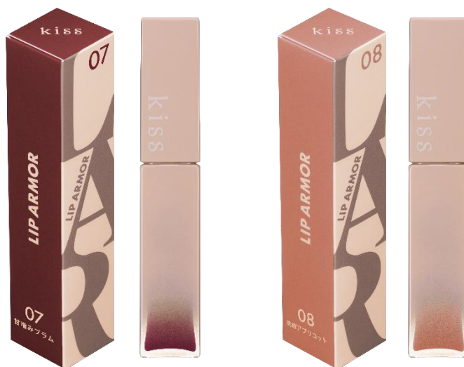
左から 07 甘噛みプラム、08 肉球アプリコット

今までになかった“ツヤ×うるおい×落ちにくい”仕上がりで人気の次世代ティントリップから、 視線を捉えて離さない、印象的な口元を叶える新色が登場！ 不安に打ち勝つ、生命力を宿すプラムレッドとアプリコットベージュの2色が仲間入り！ 唇に色が密着し、「透明ジェル膜」が唇をコート。 濡れたような光沢感がありながら、ティッシュオフしなくても色移りせず、 つけたての発色が1日中※1続きます。