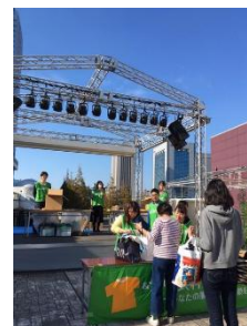
2017年10月・11月（第18回）実施時の様子