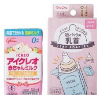
アカチャンホンポ

ミニサイズのカセットこんろです。卓上でスペースをとらず普段使いにも最適。収納もコンパクトで持ち運びにも便利です。