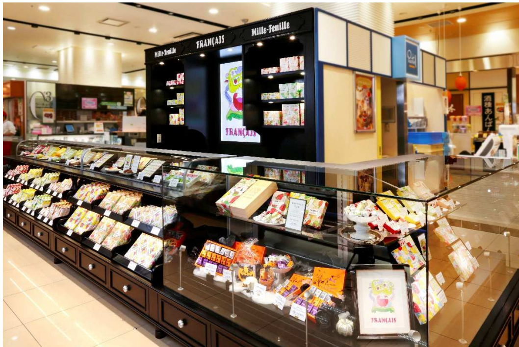
写真：フランセ ラゾーナ川崎店