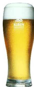
アイスコールド(イメージ)