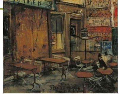
佐伯祐三 「レストラン(オテル・デュ・マルシェ)」1927年 大阪市立近代美術館建設準備室蔵