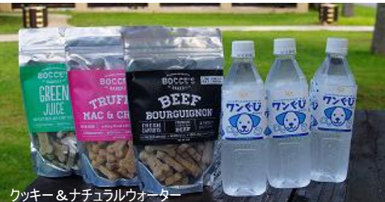
クッキー&ナチュラルウォーター