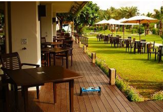
サーフサイド・カフェのワンちゃん専用席(リードフックつき)