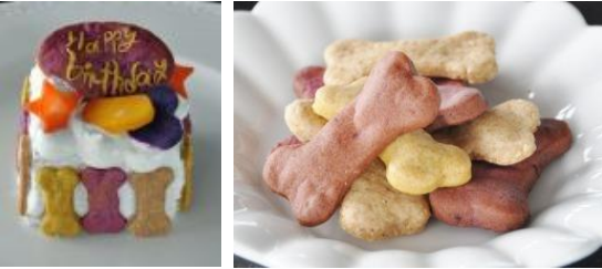
ワンちゃんのカラダにも優しい沖縄食材のメニュー