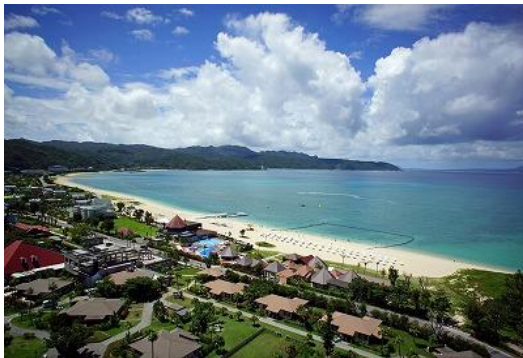
やんばるの大自然に囲まれた最高の環境

このほど、お客様より多く寄せられたご意見やリクエストを基に、ワンちゃん用アメニティ、お食事、アクティビティなど、ワンちゃんとの滞在をより快適にお過ごしいただけるよう、試泊を重ねサービスの見直しを行いました。