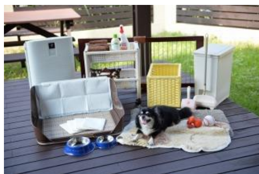
快適にお過ごせるワンちゃん用アメニティ

客室のワンちゃん用アメニティは、従来常備しているアイテムに加え、ご要望の多かった玄関用ゲートやクレートなどを追加。ワンちゃんと快適に過ごすことができる23種類のアメニティを採用しました。レストランでは、ワンちゃんと一緒にご利用いただける店舗を2店舗から4店舗へ拡大。ワンちゃん専用メニューは、調味料を一切使わずに、無添加・無着色にこだわった沖縄の厳選食材を使用しております。料理の他には、ワンちゃん用誕生日ケーキもご用意しておりますのでワンちゃんとの記念日にもお勧めです。