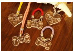
オリジナルアクセサリ