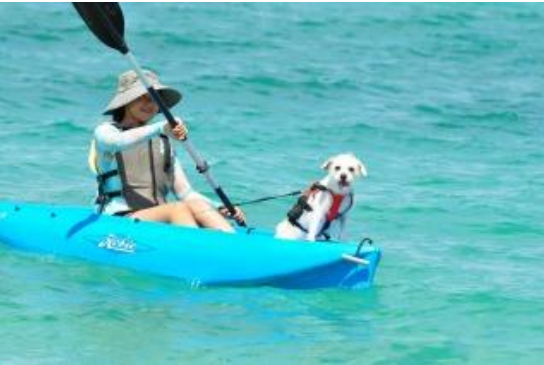
ワンちゃんと一緒にエメラルドグリーンの海を満喫(カヌー)