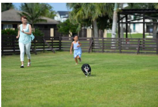
ワンちゃんルームに隣接した天然芝の広いドッグラン