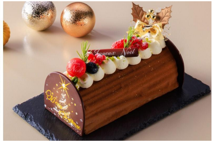
クリスマスケーキ イメージ

クリスマスケーキ詳細： https://hotelnikko-tachikawatokyo.jp/event/christmas_cake_2023/