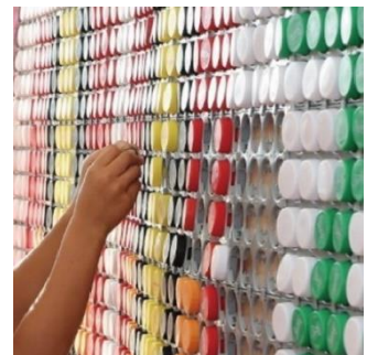
キャップアート制作イメージ