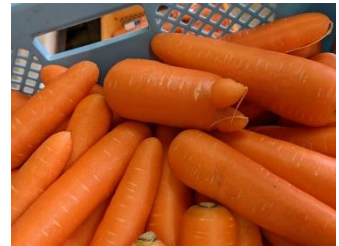
規格外のにんじん