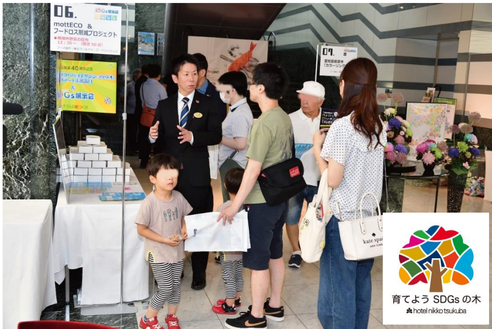
前回開催の様子(2023年6月10日)

本イベントは、当ホテルが2021年から進めているSDGsへの取り組みを地域の皆様にご紹介するイベントで、昨年につき2回目の開催となります。本年は「体験」をテーマにホテルが取り組んでいる代表的なプロジェクトの展示・体験ワークショップのほか、連携している企業による展示ブースや体験コンテンツをご用意します。