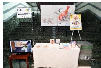
前回開催時の食用油回収の様子

使い終わった食用油から作られる航空燃料「SAF (Sustainable Aviation Fuel)」。従来の航空燃料と比較してCO 2 排出量が80%も削減できると言われています。燃料が出来るまでの工程をVRでも体験いただけるほか、ご家庭にある廃食用油の回収も行います。廃食用油お持ちいただいた方にはプレゼントをご用意しております。