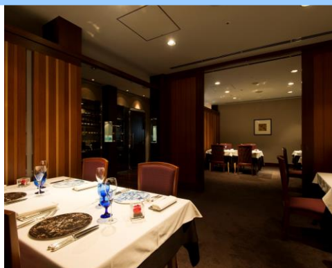
2F フランス料理「レ・セレブリテ」