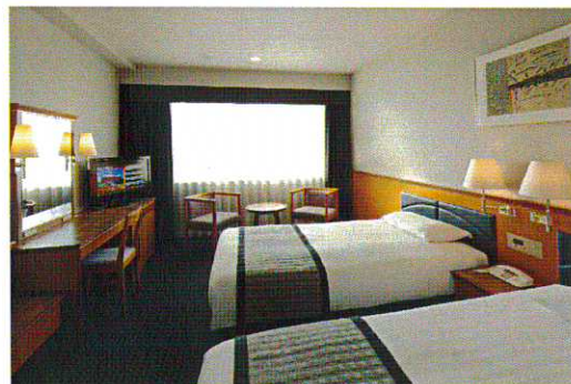
↑スタンダードツインルーム

↑プラン特典書籍 「幸せが授かる日本の神様事典 ～あなたを護り導く97柱の神々たち～」