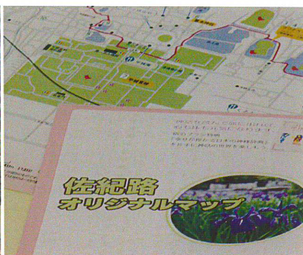
佐紀路オリジナルマップ