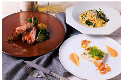
（左から時計回りに）仔羊のロースト、シラスと菜花のリングイネ、シーフードテリーヌ