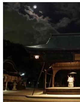
ありとほし薪能イメージ