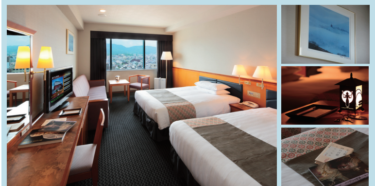
写真上『朱（あか）』・写真下『相（そう）』