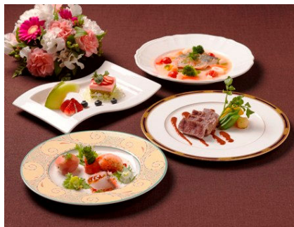
ホワイトデーディナー