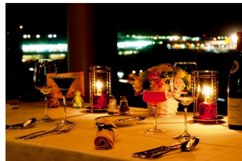
ラウンジ店内イメージ

ご予約とお問い合わせ ご宿泊 TEL:0476-32-1133（宿泊予約） お食事のみ TEL. 0476-32-0015（レストラン予約） ホテル日航成田ホームページ http://www.nikko-narita.com/