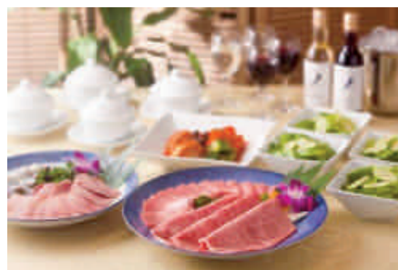
<叙々苑でのお食事ペアご招待>