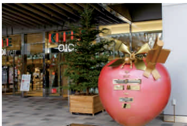
エンジェルポストと生木のクリスマスツリー