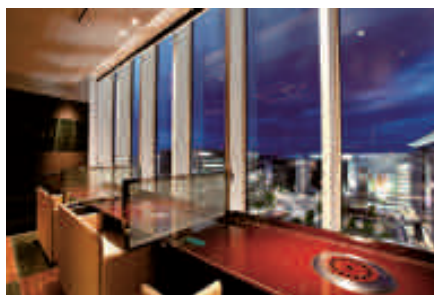
博多の夜景を一望のもとに 「叙々苑」(10階)