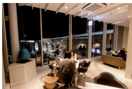
広々としたテーブル席 「PREMIO ピエトロ」(10階)