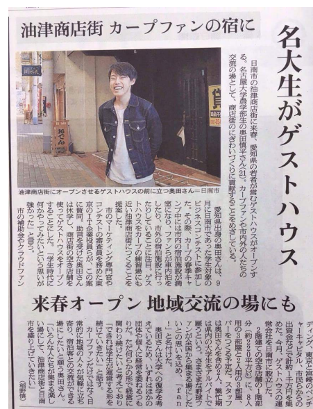
※朝日新聞掲載の様子