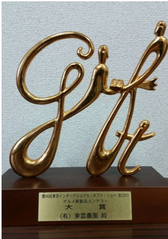
【上の写真】東京国際ギフト・ショー グルメ新製品コンテスト 大賞トロフィー

このコンテストは、ギフト・ショー会期中に「売り場のプロ」ともいべき来場バイヤーによる投票、その結果をもとに所定の審査基準に沿った最終審査が行われたグルメ新製品コンテストにて、当社の商品が大賞に輝きました。