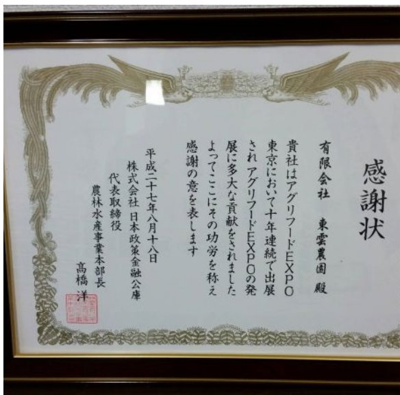
【上の写真】アグリフード EXPO 10 年連続出場感謝状

このほか、日本政策金融公庫主催の『アグリフード EXPO』に 10 年連続出場したことによる表彰を受けるなど、様々な賞を受賞しています。