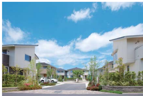
千葉県「かずさの杜 ちはら台」