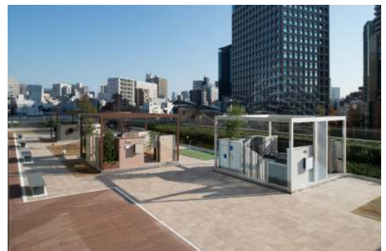
エクステリア&ガーデン

外構・植栽は、「シンプルモダン」「ナチュラル」「オーセンティック・ジャパニーズ」「テイストフル」の4つのテーマ別にコーディネートされてい