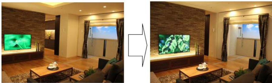
リビングの広さが変化