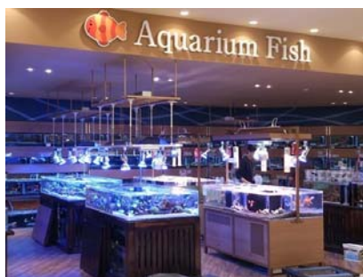
海水魚・淡水魚コーナー