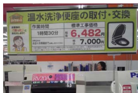
交換代行サービス