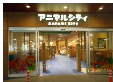
「アニマルシティ」入口

ペットフロア以外でもペット用カートに乗せれば、一緒にお買い物を楽しむことも可能です。