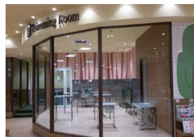
トリミングルーム