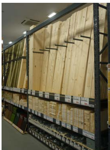
十分な在庫量の建築用資材

さらに、6月15日からは、営業開始時間を早朝6時30分に早め、現場に出向く前に資材・材料をお買い上げいただけるようにします。