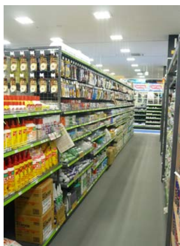
用途・サイズ別の商品