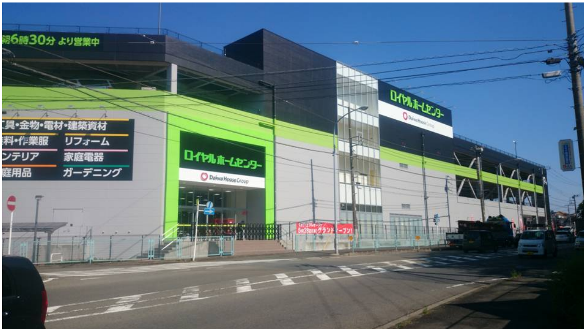
【ロイヤルホームセンター戸塚深谷店】