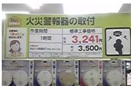
取付代行サービス