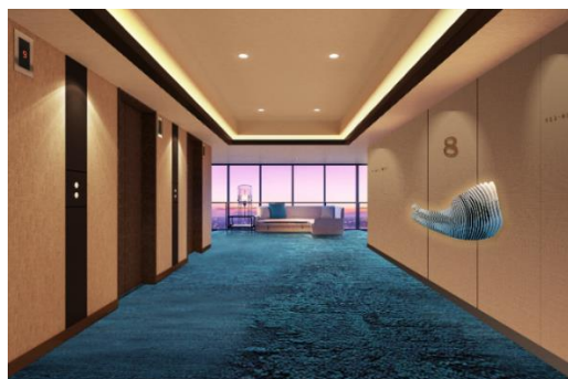
【8階エレベーター前】

8階は、唐津の自然が織りなす「白砂清松(はくさせいしょう)」をコンセプトに、海のブルー、松原のグリーン、砂浜のブラウンで表現したデザインとしました。