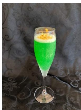
【オリジナルカクテル一例】

8階は、唐津の自然が織りなす「白砂清松(はくさせいしょう)」をコンセプトに、海のブルー、松原のグリーン、砂浜のブラウンで表現したデザインとしました。