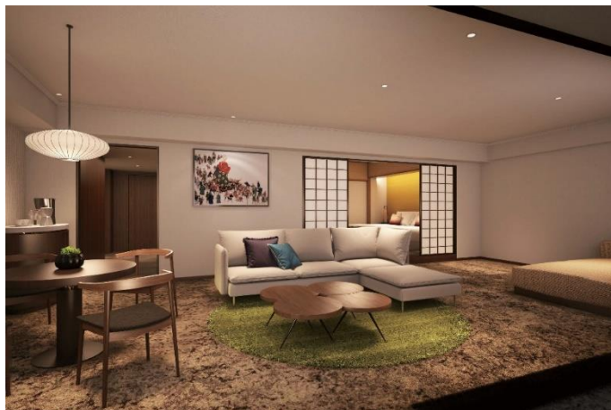
【8階「デラックススイートルーム」】

※2. 佐賀県または長崎県において生産された原料茶を使用し、仕上げ加工した茶の統一銘柄。