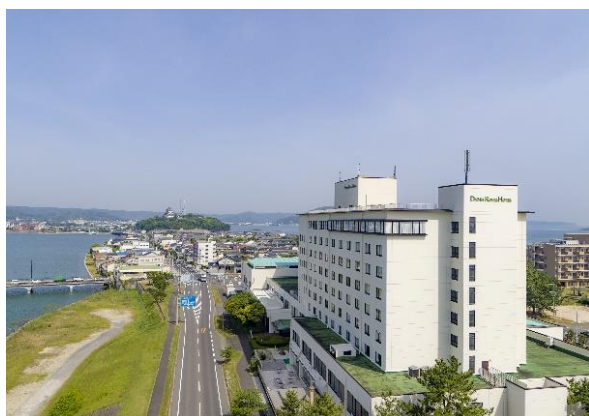
【「Hotel & Resorts SAGA-KARATSU」外観】

また、8階の南西の角部屋であるスイートルーム「CASTLE & RIVER (キャッスル・アンド・リバー)」(1室)は、唐津城と松浦川を臨め、唐津の文化を感じられる客室にリノベーションしました。