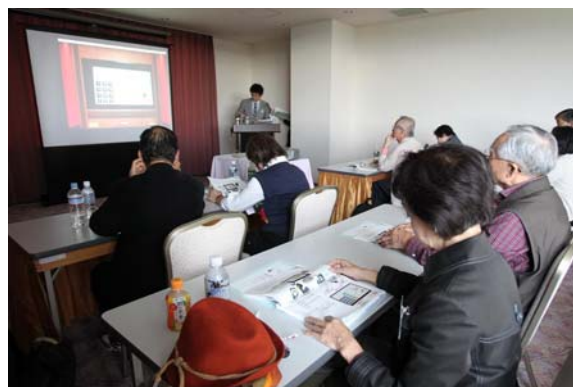
【オリエンテーションの様子（試行時）】