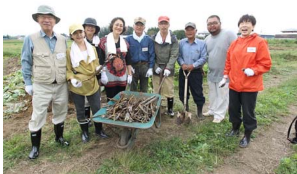
【農業体験の様子（試行時）】