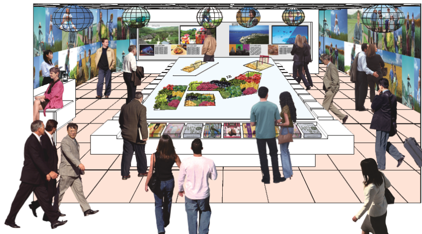
「東京駅ふるさと元気館」完成イメージ

大和ハウス工業株式会社（本社：大阪市、社長：大野直竹）は、首都圏在住者に地方都市の観光・生活情報を紹介しつつ、当社が全国で展開する新築分譲マンション情報を提供する、ふるさと応援ショップ「東京駅ふるさと元気館」を東京駅構内キッチンストリートに2015年1月24日から期間限定でオープンします。