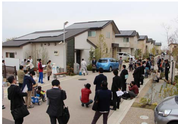
【防災イベントのようす】