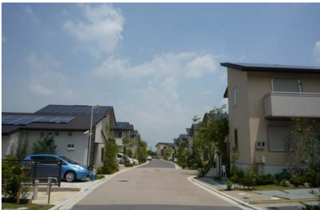
【スマ・エコ タウン晴美台（大阪府堺市）】

大和ハウス工業株式会社（本社：大阪市、社長：大野直竹）が開発・販売したスマートタウン「SMA×ECO TOWN（スマ・エコ タウン）晴美台」は、一般社団法人レジリエンスジャパン推進協議会が主催する「ジャパン・レジリエンス・アワード（強靱化大賞）2016」において、「最優秀レジリエンス賞」を受賞しました。