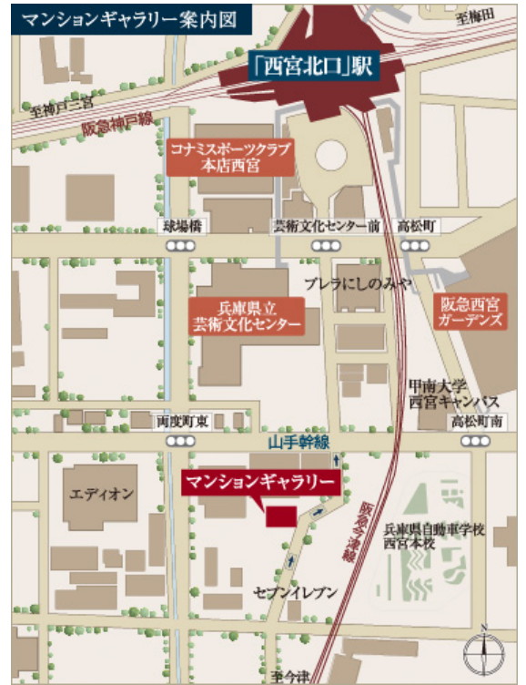
マンションギャラリー（モデルルーム）地図