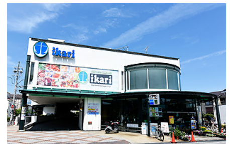
「いかりスーパーマーケット」