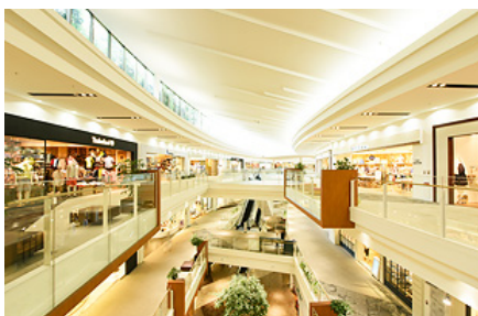
「阪急西宮ガーデンズ」

また、周辺には生活利便施設として複合商業施設「阪急西宮ガーデンズ」（徒歩15分）や「アクタ西宮」（徒歩10分）、「いかりスーパーマーケット」（徒歩10分）があり、中心街ならではの賑わいとお洒落な雰囲気を身近に感じながら生活できます。