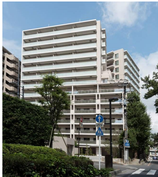
【建替え後】「プレミスト大宮氷川参道」