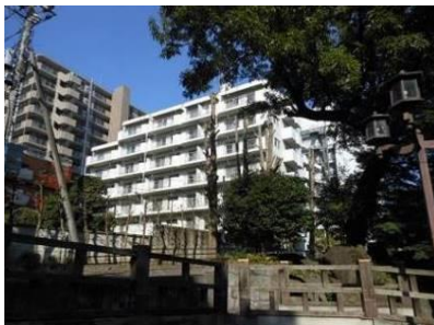
【建替え前】「大宮高鼻町ハイツ」

当事業は、JR 京浜東北線「大宮駅」から徒歩 8 分に位置する、1980 年に建設された分譲マンション「大宮高鼻町ハイツ」（地上 7 階建て、総戸数 52 戸）を、円滑化法を活用して建替えたものです。2009 年、第三者機関 ※3 により実施された建物診断・耐震診断の結果では、「大宮高鼻町ハイツ」は、建物の一部で耐震性能を満たしておらず、また、給水タンクやエレベーター等の設備の劣化も見受けられたため、住民主導により建替えることとなりました。