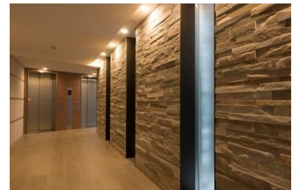
【建替え後】エントランス