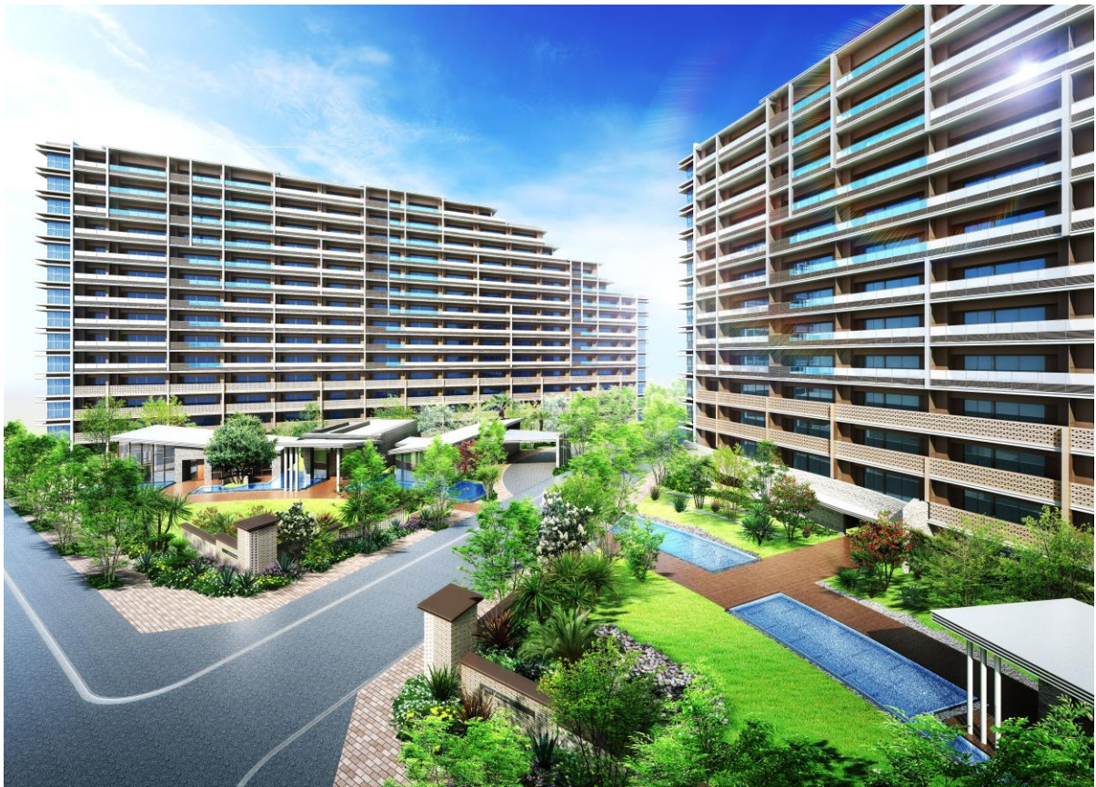
「(仮称) プレミスト湘南辻堂」完成予想パース