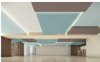
【フィットネスジム】