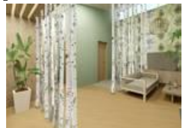
【ゲストルーム (左から茶室、山小屋、隠れ家)】