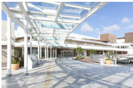
【テラスモール湘南】

さらに、徒歩圏内に「藤沢市立明治小学校」(徒歩 17 分)、「藤沢市立明治中学校」(徒歩 6 分) や「湘南藤沢徳洲会病院」(徒歩 6 分) など、教育施設や医療施設も充実しており、緑あふれる「藤沢市立神台公園」(徒歩 5 分) など豊かな自然環境も隣接しています。