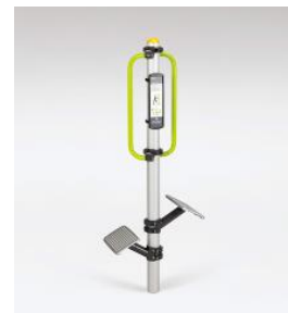
【屋外トレーニング器具】