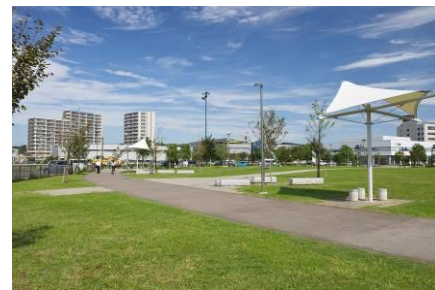
【藤沢市立神台公園】