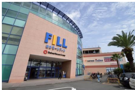
【湘南モールフィル】