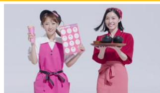
AKB48 メンバー) 良いバイトでみんな輝け！