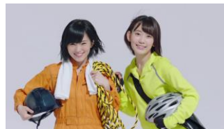
AKB48 メンバー) バイト探しは