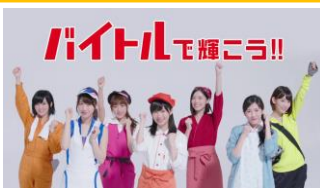
AKB48 メンバー) バイトルで輝こう！