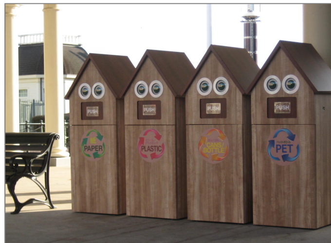
センサーや通信機器を搭載した『スマートゴミ箱』の外観

なお、今後『スマートゴミ箱』は、大型のリゾート施設やショッピングモールなどへの展開も視野に入れております。