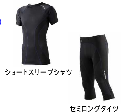
ショートスリーブシャツ